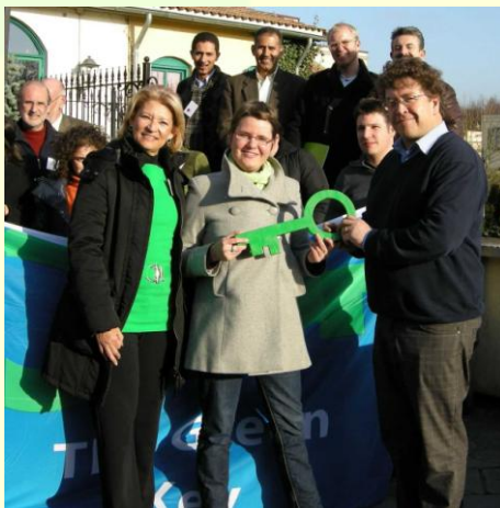
foto 'National Operators Meeting' Green Key januari 2009 te Zeewolde

Green Key in Nederland maakt deel uit van een internationaal netwerk van Green Key bedrijven. In totaal zijn er in 14 landen Green Key accommodaties. In totaal zijn er momenteel zo'n 850 Green Key ondernemingen (tegenover 620 in 2008). Op de website www.green-key.org treft u een overzicht aan van deze landen. Tevens is een aantal landen Green Key in voorbereiding. Dit ondermeer in Puerto Rico, Spanje, België Wallonië, Polen en Griekenland.