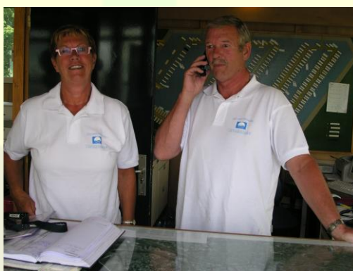
Jachthaven Rhoon/Rhoonse Grienden (Rhoon)

Onze inspecteurs zijn momenteel weer volop aan het inspecteren voor de Blauwe Vlag. Het is dan heel leuk om enthousiaste en trotse Blauwe Vlag deelnemers aan te treffen en op Jachthaven Rhoon onderstaande foto te kunnen maken.